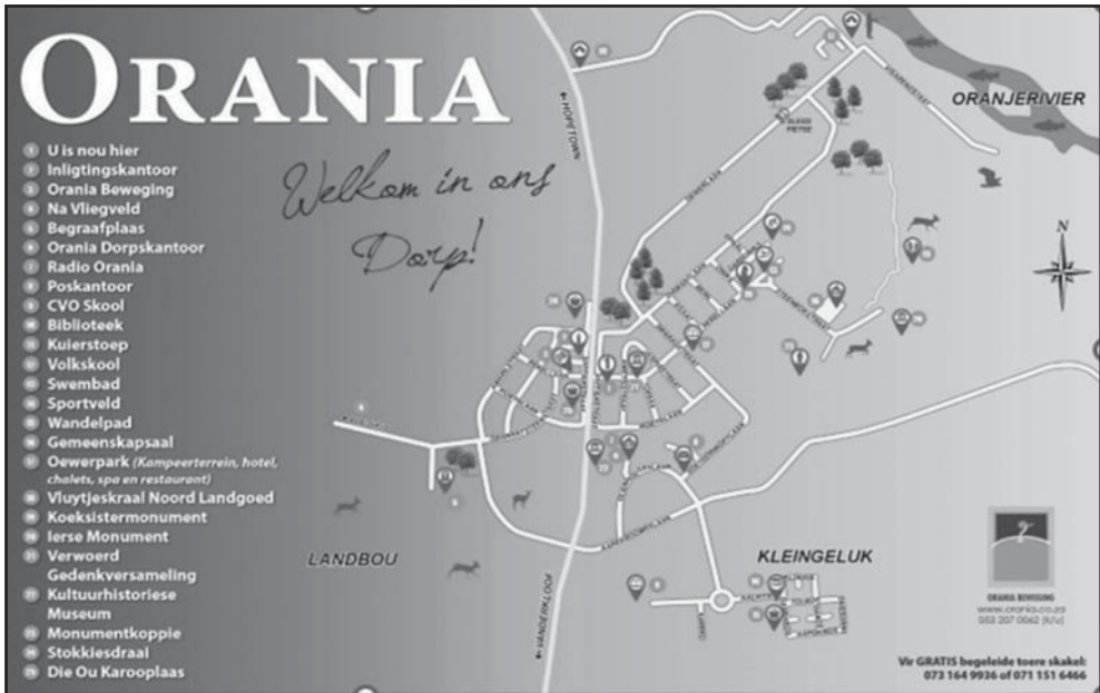
Figuur 2: Uitleg van Orania