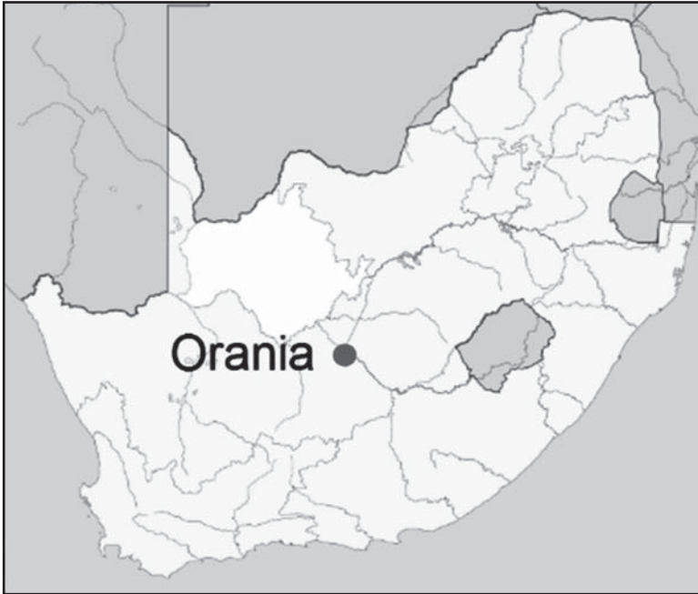
Figuur 1: Ligging van Orania aangedui op 'n kaart van Suid-Afrika

Orania is geleë op die suidelike oewer van die Oranjerivier in die Noord-Kaapprovinsie van Suid-Afrika. Die naaste dorpe is Hopetown, sowat 43 kilometer ver in 'n noordwestelike rigting, Vanderkloof, sowat 49 kilometer ver in 'n suidoostelike rigting, en Petrusville, sowat 51 kilometer ver, ook in 'n suidoostelike rigting. Orania is sowat 160 kilometer suid van Kimberley. Figuur 1 dui die ligging van Orania in Suid-Afrika aan. Dit blyk dat die dorp naby aan die middelpunt van die land geleë is.