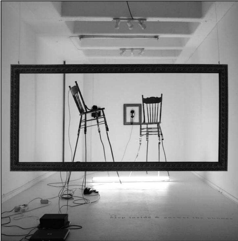
Figuur 1: Jenna Burchell, Family Portrait , 2007. Interaktiewe klankinstallasie. 3 500 mm (b) x 5 000 mm (d) x 3 000 mm (h). Stelte, tou, postkoloniale stoele, raam, telefone, aangepaste kringbaan. Met vergunning van die kunstenaar. Kopiereg Jenna Burchell.

Family Portrait is 'n voorstelling van die kunstenaar se familie, wat oor die aarde versprei is (Figuur 1). Die installasie bestaan uit twee stoele waarvan die pote aan lendelam stelte vasgemaak is. Op elke stoel is daar 'n telefoon in plaas van 'n persoon, wat in elk geval sou sukkel om nie van hierdie hoë sitplekke af te val nie. Werklike liggame kan klaarblyklik nie maklik deel van hierdie portretopset wees nie. Nog 'n telefoon hang teen die muur in 'n raam. Aan die een kant word die installasie deur 'n massiewe raam omring, en die gehoor word versoek om in te stap en die telefone te beantwoord. Wanneer die raam betree word, lui 'n