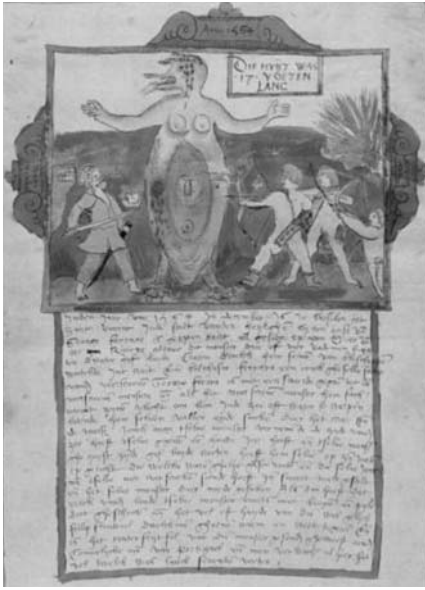
Illustrasie 1: Die Brasiliaanse monster 13