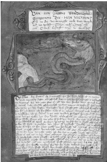
Illustrasie 2: 'n Seeslang

Ander bekende monsters wat in VB voorkom is die meerminne en meermanne (kategorievermenging van MENS en VIS), verskeie drake, met as hul eweknie, verskeie seeslange wat almal die mens vyandig gesind is en hom konstant bedreig (sien Illustrasie 2).