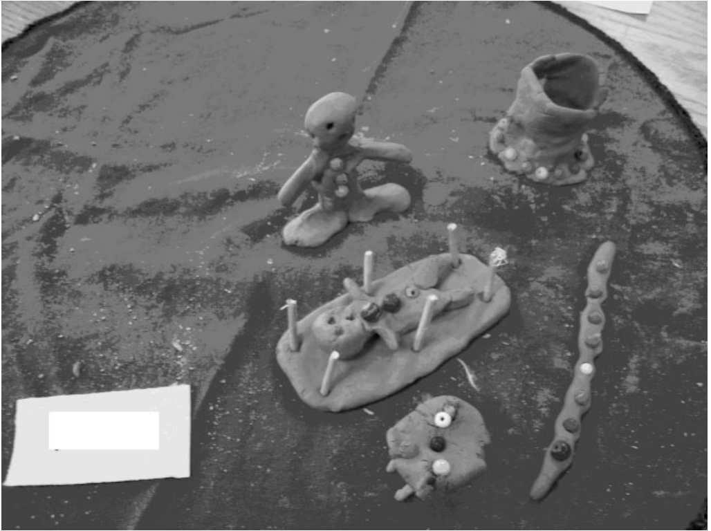
Figuur 3: Uitbeelding van die vrou se rolle en funksies.

dat sy al die eiers in een nes bymekaar moes hou), die kospotte (“van Egipte,” soos wat sy gekook het) en ’n “kerfstok” (wat haar beleving dat die lewe verbygegaan en verander het, uitbeeld).