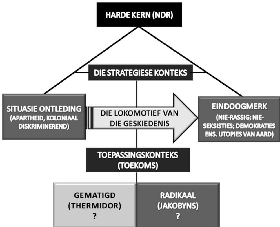
Figuur 1: Die NDR as ideologiese denkraamwerk.

Hierdie perspektief stem meer ooreen met die huidige omstandighede binne die Suid-Afrikaanse politieke omgewing (staat en regime), wat 'n meer radikale toepassing van die NDR (ten minste op hierdie tydstip) onwenslik maak. Die harde logika van die rewolusionêre stryd word ooreenkomstig dié denklyn verwater deur pragmatiese (kontekstuele) oorwegings wat sterker vooropgestel word. Hierdie benadering is gelykstaande aan dié van Mao Zedong: “let a hundred flowers bloom”, wat onlangs só deur die ANC vertolk is: